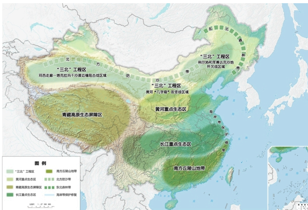
图3 重要生态系统保护和修复重大工程布局图