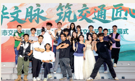
行者天空校园电视台