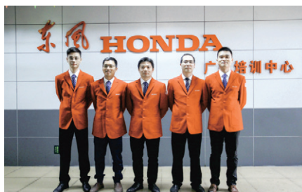
东风本田培训师团队