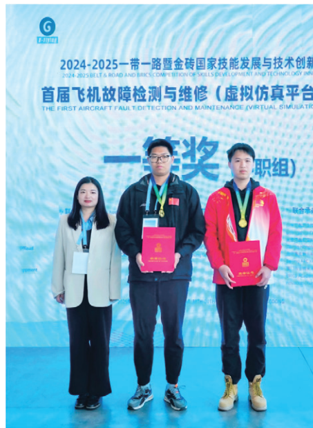
学院学生荣获2025一带一路暨金砖国家技能发展与技术创新大赛首届飞机故障检测与维修（虚拟仿真平台）赛项金牌。