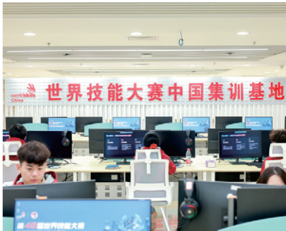
世界技能大赛数字交互媒体设计项目中国集训基地