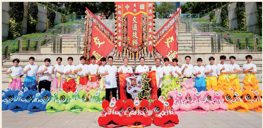
学院醒狮队受邀参加十五运会开幕式醒狮项目表演，学生被选为醒狮方阵中“1号狮”。