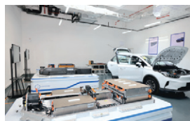
宁德时代后市场人才培养基地