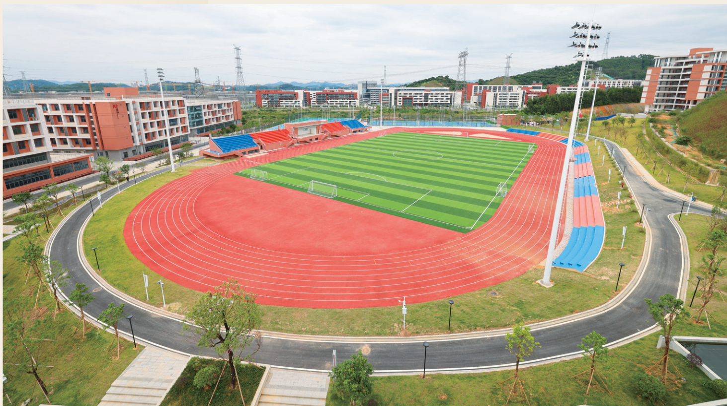
400米标准田径运动场