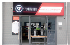
顺丰速运产教研实训基地