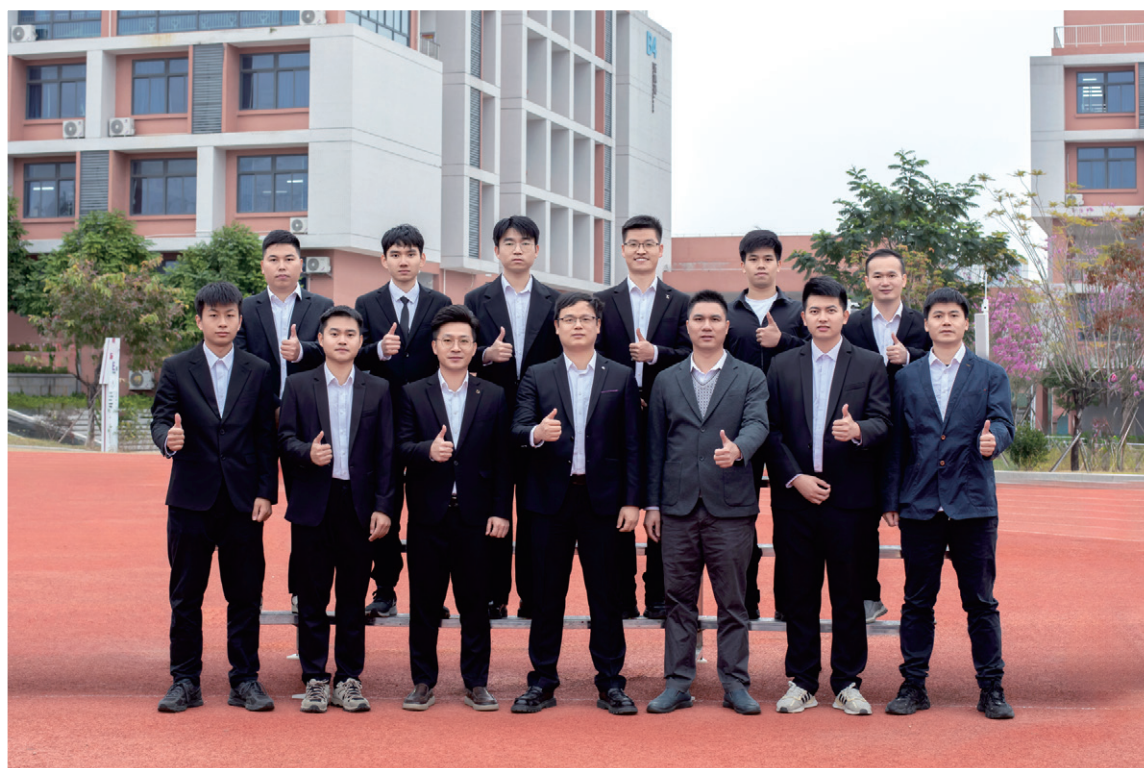
国家级技术能手（部分）