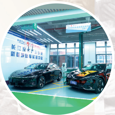
长安汽车产业学院