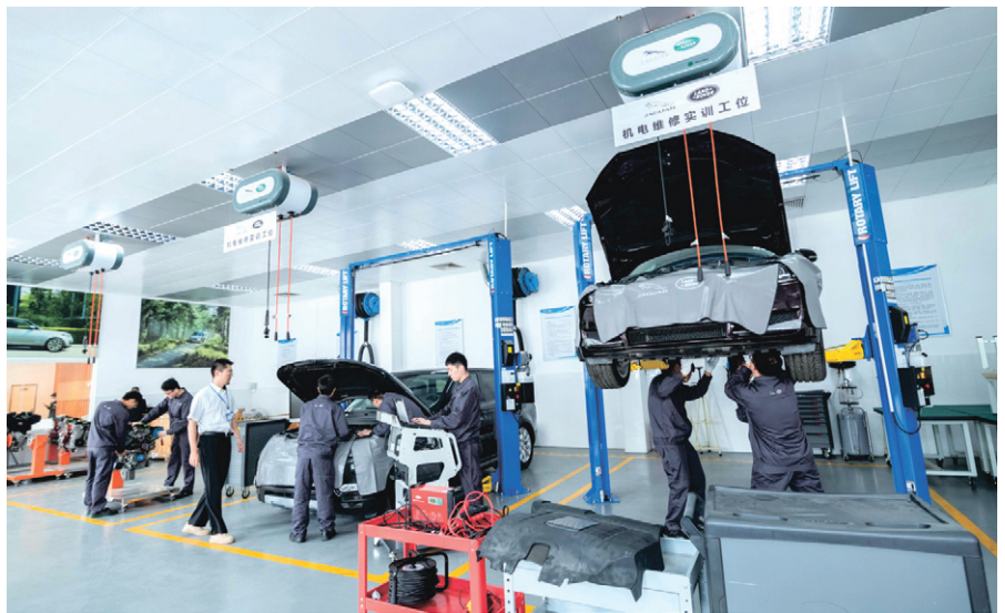
捷豹路虎校内实训基地