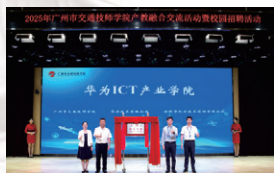
华为ICT产业学院揭牌仪式