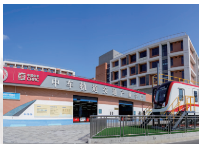
中车轨道交通产业学院