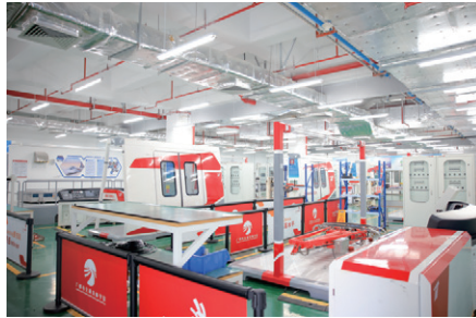
轨道交通车辆技术实训中心