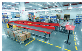
京东智能供应链产业学院