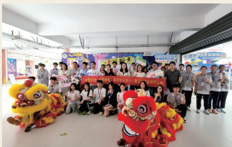
学生创新创业协会