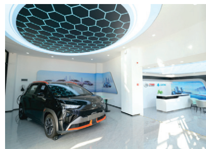
广汽埃安新能源汽车实训中心