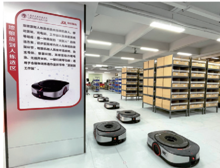
京东智慧物流实训中心