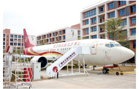
航空服务实训基地