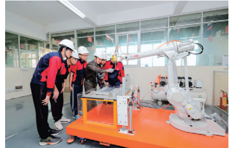
工业机器人工作站实训室