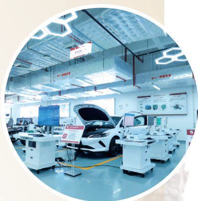
比亚迪汽车产业学院

学院坚持高端引领、产教融合办学，主动对接地区战略性新兴产业、先进制造业和现代服务业，精心打造“高标准、全过程、深层次”的校企合作模式，致力于培养与市场需求紧密接轨、与产业技术发展相适应的高技能人才，积极探索多种模式的校企合作办学方式，全面践行“校企双制，工学结合”办学模式，将行业标准、岗位关键技能引入课程，加强学生技能水平与岗位能力的无缝对接，满足企业对高技能人才的需求，实现“招生即招工，入校即入企”。