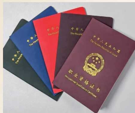
国家职业资格证书