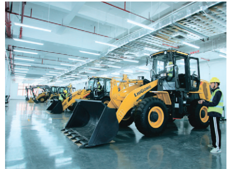
世界技能大赛重型车辆技术项目中国集训基地