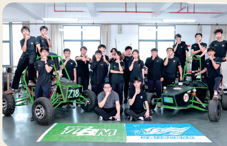
交通行者巴哈车队

学院坚持“人文与技能并重、专业能力与职业素养并举”的人才培养特色。以“百团大战、百花齐放、百果飘香”为育人导向，全面推进“一人一社团、一班一特色、一系一品牌”的育人目标。学院高度重视学生德育养成，以社团课程、活动育人和以赛促教为抓手，构建社团课程一体化教育体系，促进学生德、智、体、美、劳全面发展。目前，学院已开设思政类、体育类、艺术类、技能类等100余个社团课程，供学生自主选择。校园文化艺术节、体育节、技能节及校运会等大型活动，覆盖全体学生，营造了浓厚的人文实践氛围。