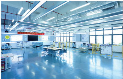
供应链智能生产运作数字孪生实训室