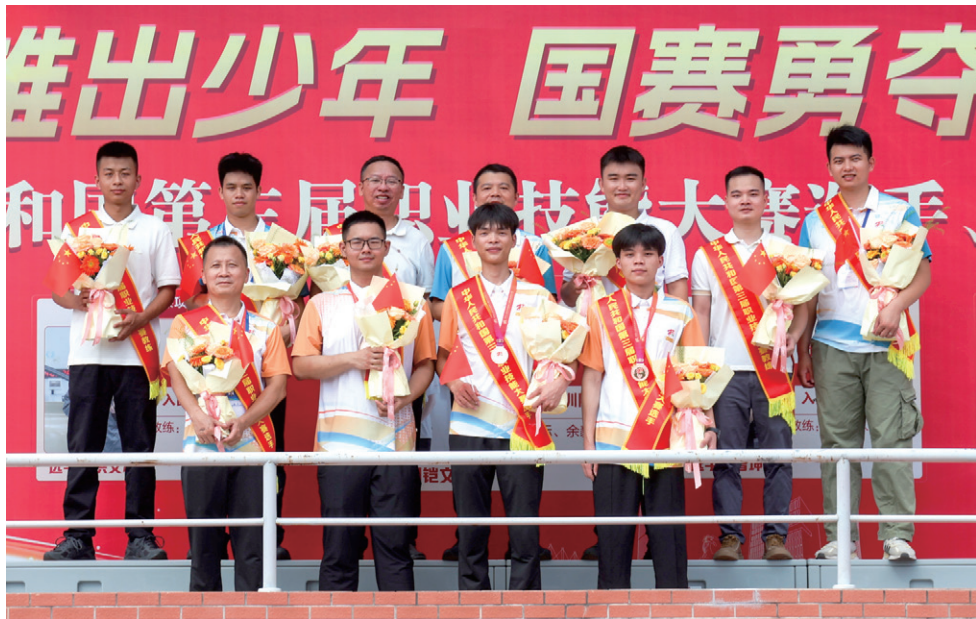
中华人民共和国第三届职业技能大赛中载誉归来的学院师生团队（部分选手）