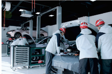
新能源汽车实训中心