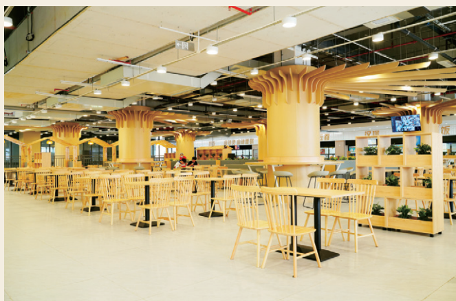
菜品丰富的学生餐厅