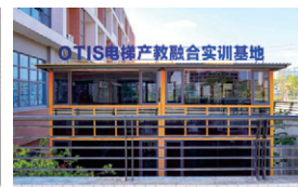
OTIS电梯产教融合实训基地